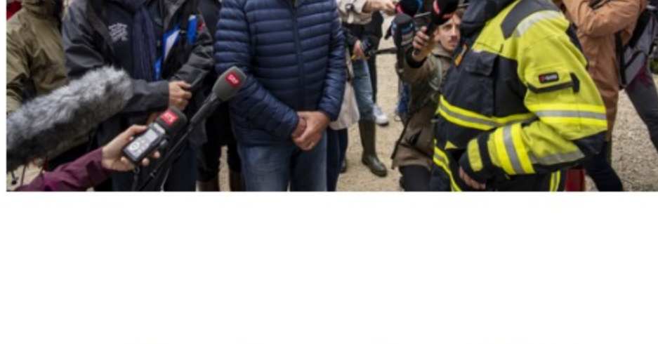
Guy Parmelin en visite à Lucerne.

L'eau du lac atteignait 434,77 mètres jeudi matin. Ce sont deux centimètres de plus que le niveau le plus élevé prévu par l'échelle des dangers de la confédération (5 sur 5). Si l'eau monte encore jusqu'à 434,9 mètres, une partie du centre-ville sera inondée. Guy Parmelin a rendu visite jeudi après-midi aux forces d'intervention de la ville de Lucerne qui luttent contre les inondations et devait ensuite se rendre à Aesch, pour faire un point sur la situation du lac Hallwil.