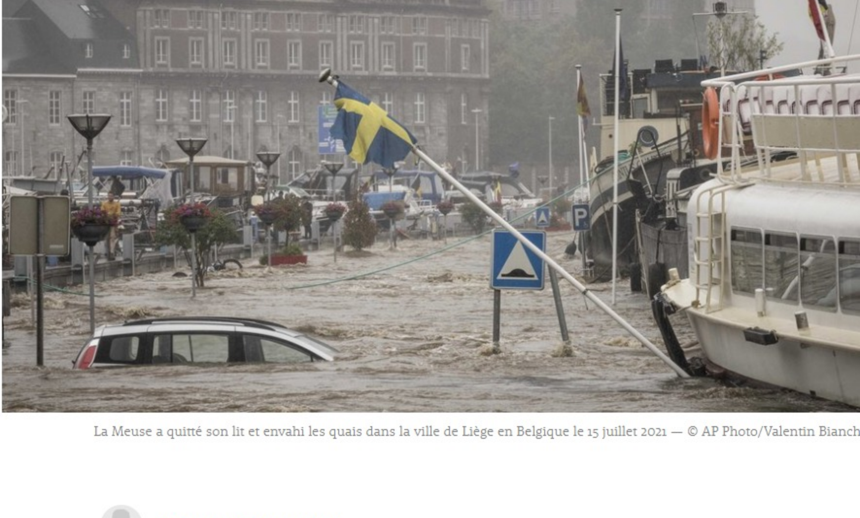
La Meuse a quitté son lit et envahi les quais dans la ville de Liège en Belgique le 15 juillet 2021

Les pluies diluviennes ont fait au moins six morts en Belgique. À Lucerne, le lac des Quatre-Cantons est à 13 cm d'inonder le centre-ville. Les autorités allemandes ont annoncé le décès de 42 personnes. Notre suivi des intempéries en Suisse et en Europe