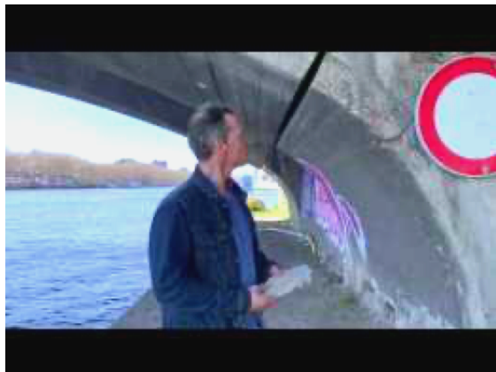
Trois ans de prison avec...