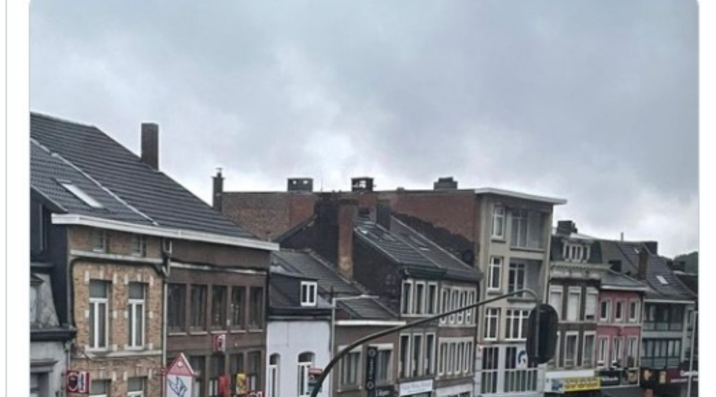
En Belgique les voitures flottent en pleine rue

Selon la chaîne RTBF , cela porte à au moins six morts le bilan des inondations liées aux pluies diluviennes qui ont frappé ces derniers jours en particulier la Wallonie (Sud et Est francophone).